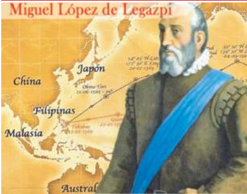
Miguel López de Legazpi, jefe de la expedición de México a Filipinas, con 350 hombres, entre ellos 4 agustinos.

poner una conquista española de China, a semejanza de América, pero nunca llegó a realizarse.