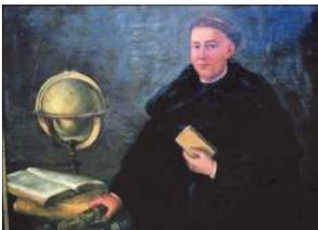
San Francisco Javier soñó con pasar a China y, casualidades de la vida, fue otro navarro, Martín de Rada, quien lo consiguió 23 años más tarde.