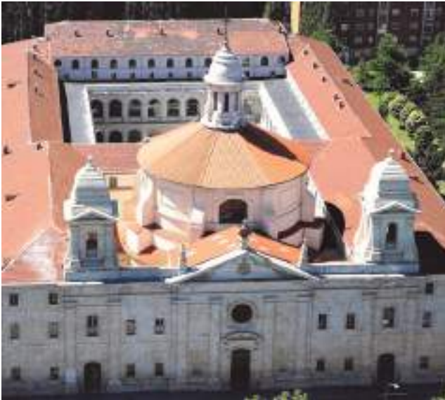
Convento de Agustinos de Valladolid, desde donde más de tres mil misioneros partieron para Oriente.

Martín en el Oriente siguió predicando sus convicciones religiosas y la atención a los pobres, de manera que se le llamó, con razón, " el fray Bartolomé de las Casas de Filipinas ". Como ejemplo de su generosidad, ante la hambruna de toda la zona, vendió los cálices de plata, regalados por el rey, para poder distribuir arroz a todos sus habitantes.