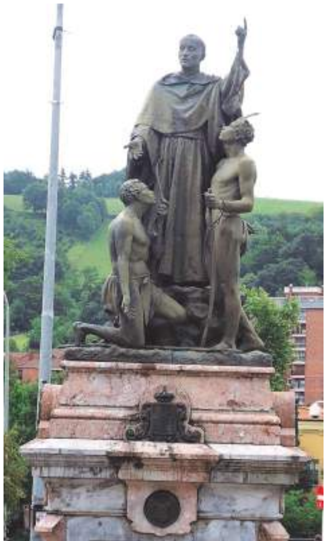
Ordizia (Guipúzcoa). Monumento a Andrés de Urdaneta y Ceráin, agustino (1508-68). Militar, marino, explorador y cosmógrafo; de vocación religiosa tardía.