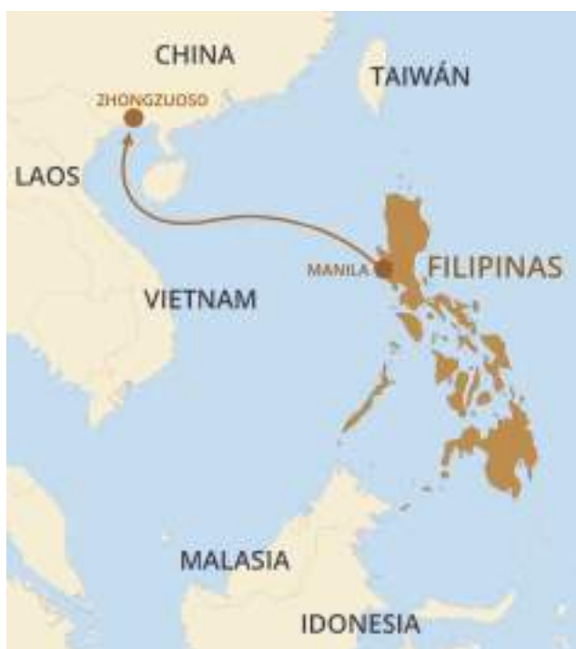
Trayecto que realizó el agustino Rada para adentrarse en Filipinas y China.

En 1560, fue destinado a Toledo, de donde pasó a México, como misionero. Aquí elaboró una gramática de la lengua otomí (idioma auténtico de México). Felipe II le propuso ocupar el episcopado de México, pero renunció para ser un humilde y auténtico misionero dedicado a extender la doctrina cristiana.