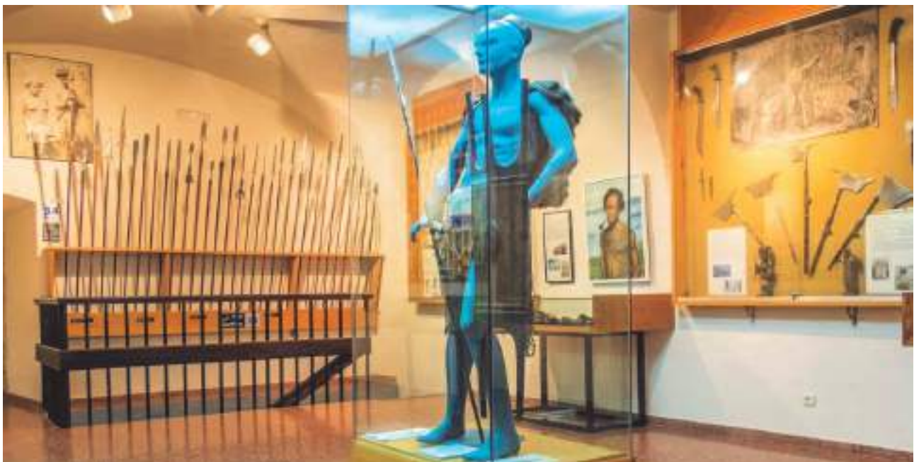
Museo de los Agustinos Filipinos de Valladolid, especializado en temas orientales.