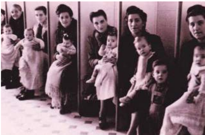
Campaña de vacunación infantil.