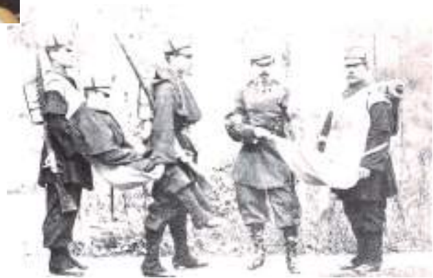
Mandil ideado por Nicasio Landa para transporte de heridos.

Sus obras personales más conocidas son, a nuestro entender: "La Sanidad española en el siglo XIX", una publicación que debieran leer todos los estudiantes de medicina, para que conocieran en qué consiste, el empezar a avanzar en temas de salud, desde la cota cero. Señalaríamos asimismo la monografía dedicada al ilustre médico navarro" Nicasio Landa Álvarez de Carballo" (Pamplona 1830-1891) cofundador de la Cruz Roja, que sentó las bases de la caridad en la guerra, con aquella célebre frase: "Desde el momento que un soldado queda herido al pie de una bandera, se convierte en un ser sagrado". No olvidamos tampoco: "Vacunación antivariólica", un libro con valor añadido, donde nuestro protagonista fue recopilando historias y escritos antiguos, que procedían hasta del propio Edward Jenner, el médico inglés descubridor de la vacuna.