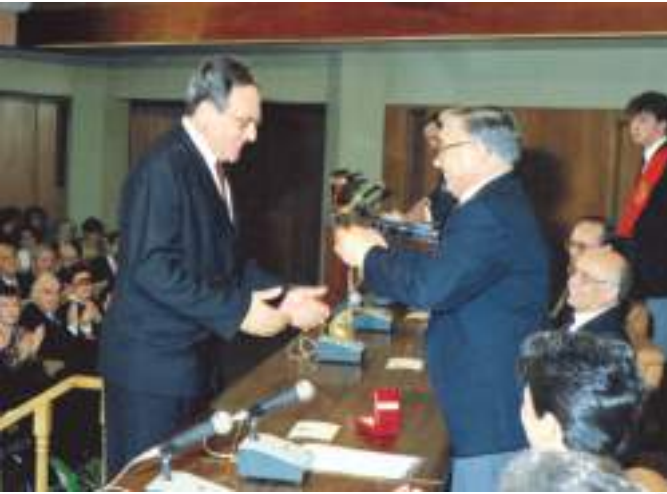
Recibiendo la Medalla de Plata de la Universidad de Navarra.