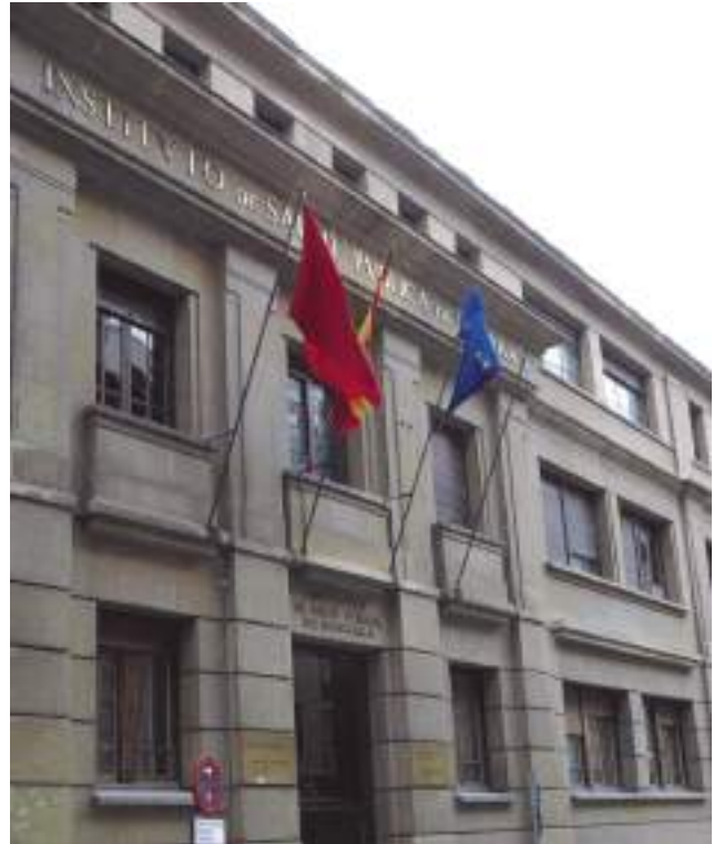
Instituto de Higiene y Salud Pública de Pamplona.