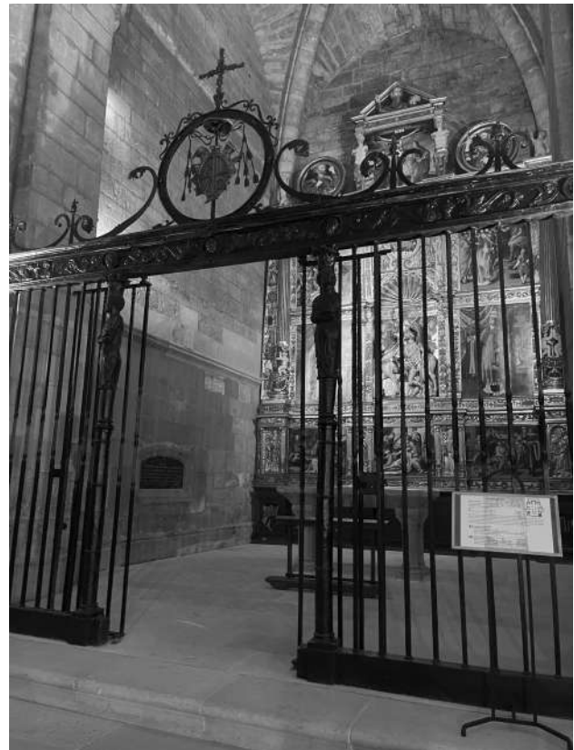
Capilla de San Martín de la Catedral de Tudela.

Vista la situación, Paulita abandonó pronto la capital y emprendió con su hijo el largo viaje hasta Burdeos donde se había establecido el conde de Sástago. A partir de ese momento todo pareció acelerarse. El 20 de diciembre de