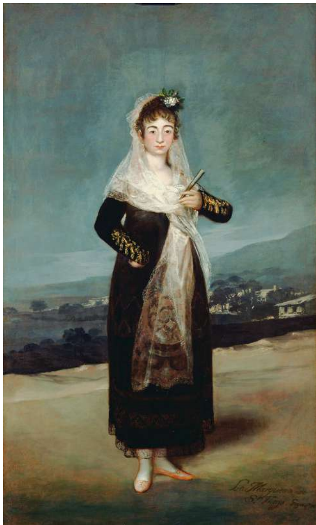
Retrato de la Marquesa de Santiago por Goya (1809). The Paul J. Getty Museum, Los Ángeles (EEUU).

tas que conserva el archivo familiar y que esperan un estudio que está por hacer.