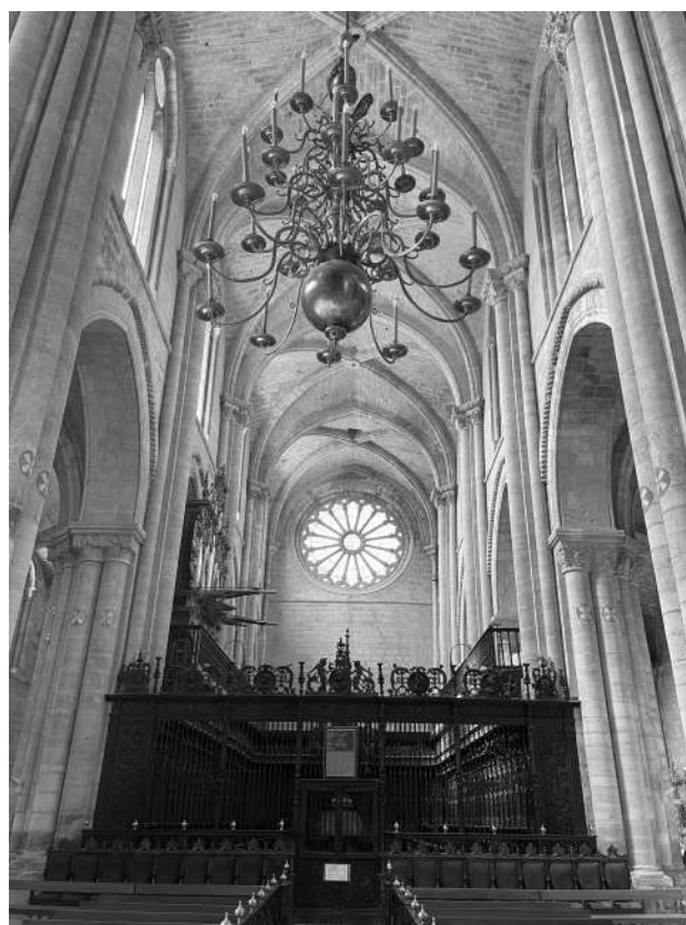
Nave central de la Catedral de Tudela.

Los marqueses profesaban ideas ilustradas y reunían en su palacio una concurrida tertulia a la que acudían literatos de moda. Reparemos que el marqués tuvo toda su vida gran relación y amistad con el dramaturgo Leandro Fernández de Moratín, como demuestran las car-