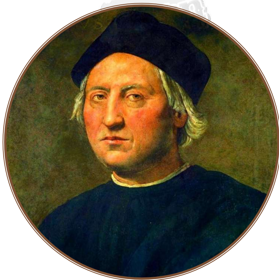
Cristóbal Colón, del pintor italiano Ghirlandaio

E Toda la historiografía colombina recoge la actitud personal de Colom como guardián de un secreto que quería no confiar a nadie. En realidad, guardaba dos secretos que muchas de las altas instancias tuvieron que conocer, y desde luego los reyes católicos y también los servidores de Estado de su Gobierno y Consejo, entre ellos: el franciscano Fray Pérez de la Rábida, el tesorero Santángel; el secretario, tesorero, e historiador Pedro Mártir de Anglería, los duques de Medinaceli. Uno de los se-