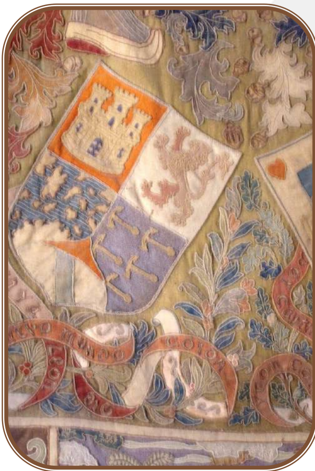
Repostero (s. XVIII) del Castillo de la Mota con las armas familiares de Colom. En el entado, la banda azul, distintivo del Reino de Mallorca.

Si trasladamos los hechos a la Navarra del XV, sería impensable que Carlos el Noble concediera las cadenas de Navarra y títulos de Condestable y Mariscal a alguien que no fuera de sangre real, aun bastarda. Eso mismo